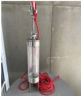
เครื่องเก็บตัวอย่างน้ำแนวตั้ง