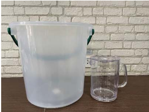
ถังเก็บตัวอย่างน้ำ