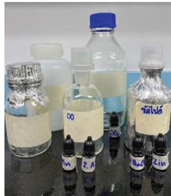
ขวดเก็บตัวอย่างน้ำ